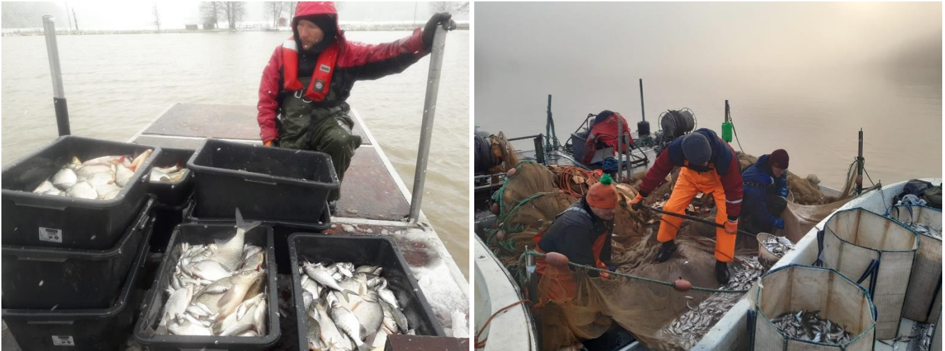
Kuva 1. Paunettipyyntiä keväällä (vas) ja nuottausta syksyllä (oik.).

Paunettipyynti toteutettiin kolmella pyydyksellä Seittelinlahdella Paijalan osakaskunnan aloitteesta. Kevään saalis oli 2 400 kg. Saaliissa oli sorvaa, lahnaa ja särkeä.